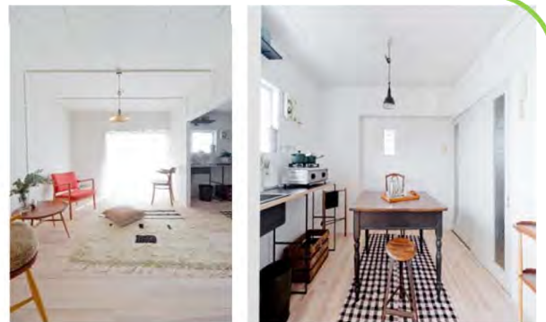
リノベーションを行った住戸（鶴甲団地）

団地内の既存住宅の流通促進や若年世帯の団地への流入を通して、地域を活性化させることをめざし、平成26年度から鶴甲団地で取り組みを行いました。平成28～29年度にかけては、神戸市と連携して高倉台団地でリノベーションモデルルームの整備・公開、イベント「団地カエル in 高倉台」などによる住情報の発信等といった取り組みをしています。